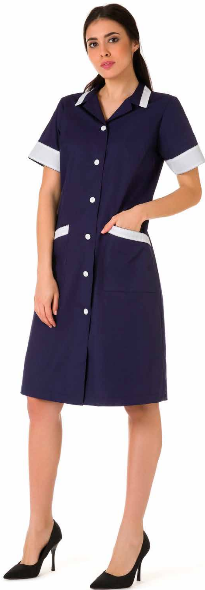
CMD334 Camice Donna 65% Poliestere - 35% Cotone Taglie: XS, S, M, L, XL, XXL Colore: A304 (Blue Navy) + Bianco