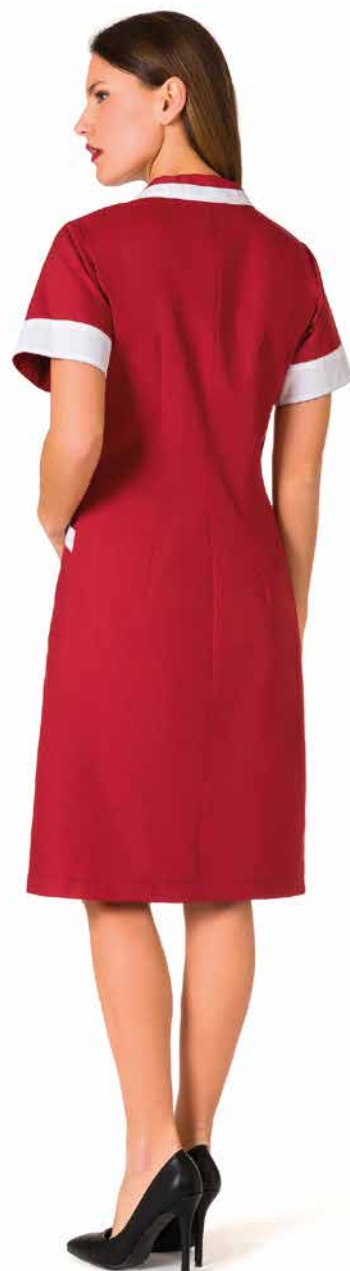
CMD334 Camice Donna 65% Poliestere - 35% Cotone Taglie: XS, S, M, L, XL, XXL Colore: A587 (Bordeaux) + Bianco