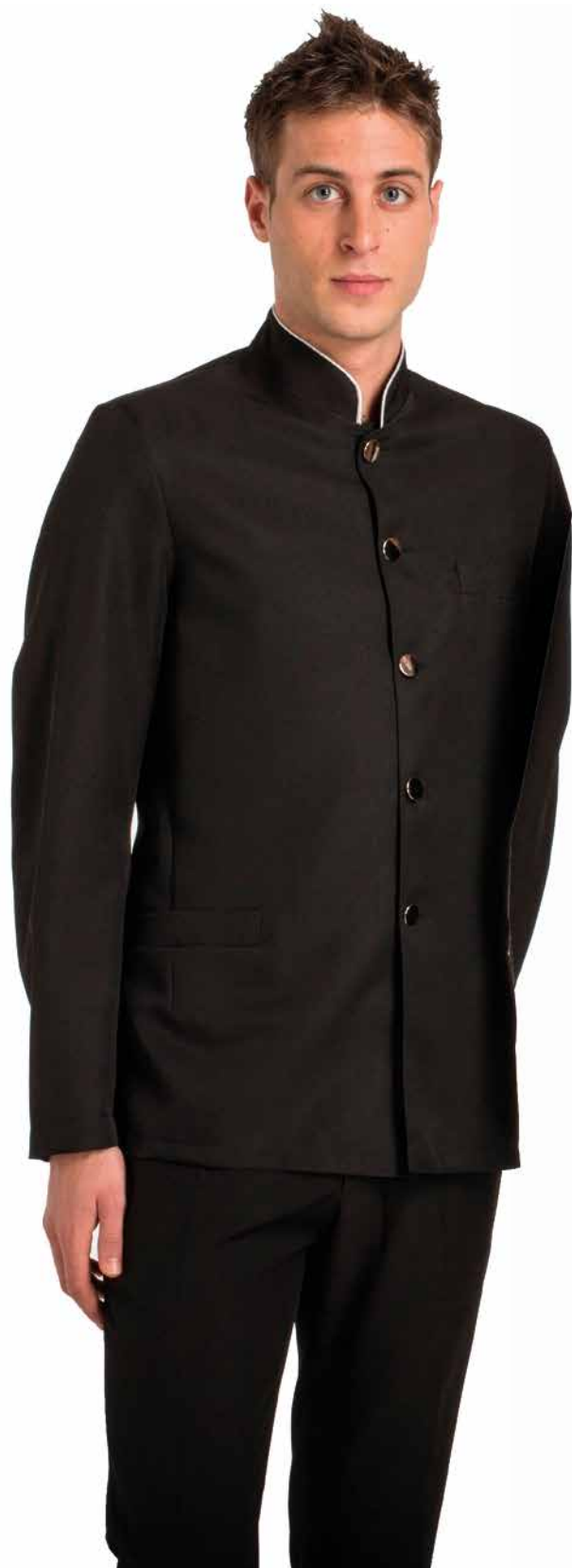
GIU074 Giacca Uomo Coreana 100% Poliestere Taglie: S, M, L, XL, XXL Colore: Nero + Fil. Argento