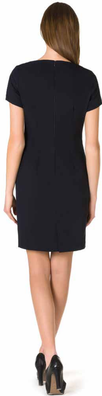
VED667 Abito Donna 97% Poliestere - 3% Elastan Taglie: 38-40-42-44-46-48-50 Colore: Nero