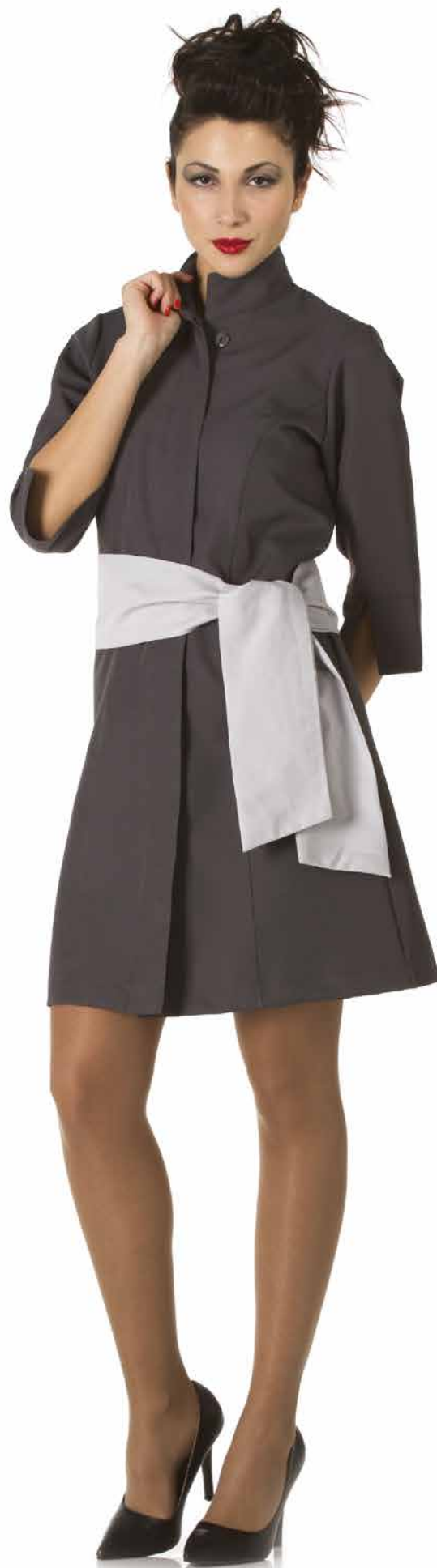
VED363 Abito Donna 100% Poliestere Taglie: XS-S-M-L-XL-XXL Colore: 960 (Grigio) + 141 (Grigio Chiaro)