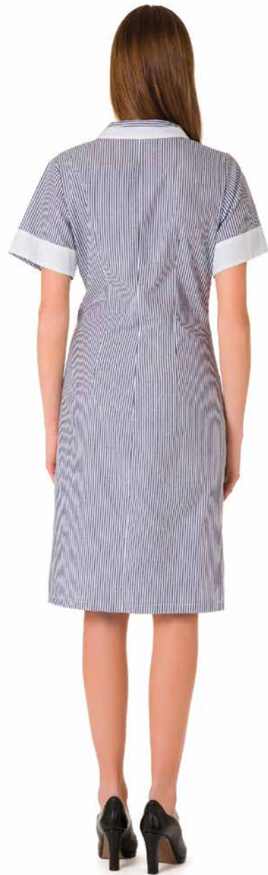
CMD334 Camice Donna 65% Poliestere - 35% Cotone Taglie: XS, S, M, L, XL, XXL Colore: 83-18 (Riga Blue) + Bianco