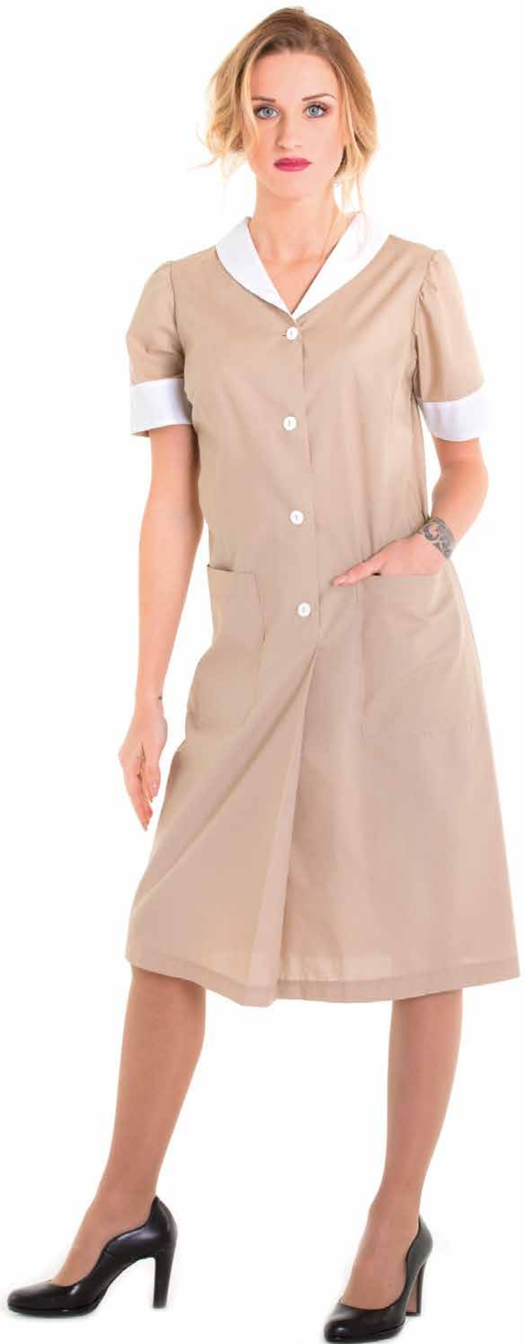
CMD-01 Camice Piani chiuso Donna 65% Poliestere - 35% Cotone Taglie: XS, S, M, L, XL, XXL Colore: 74-17 (Beige) + Bianco