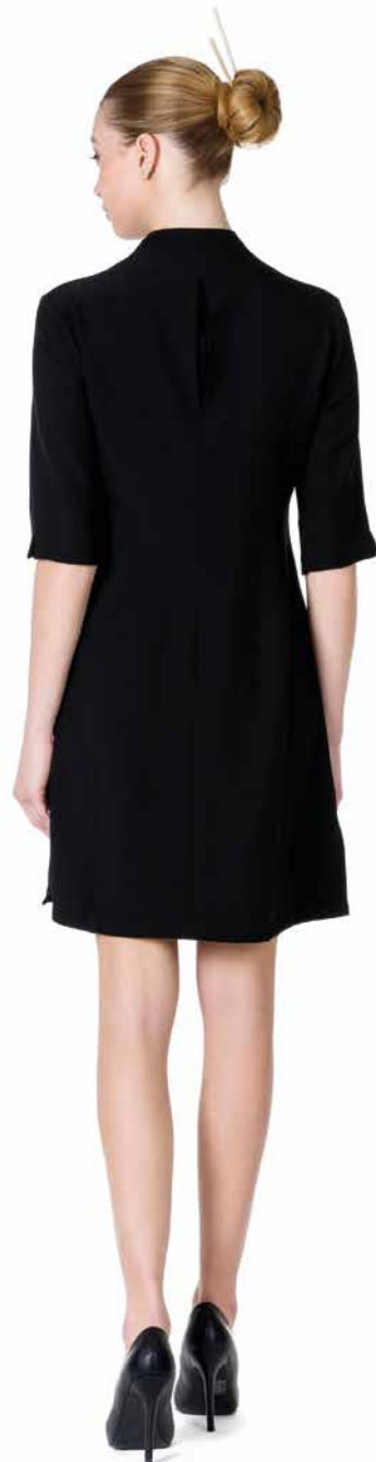
VED378 Abito Donna 97% Poliestere - 3% Elastan Taglie: 38-40-42-44-46-48-50-52-54 Colore: Nero + 114 (Argento)