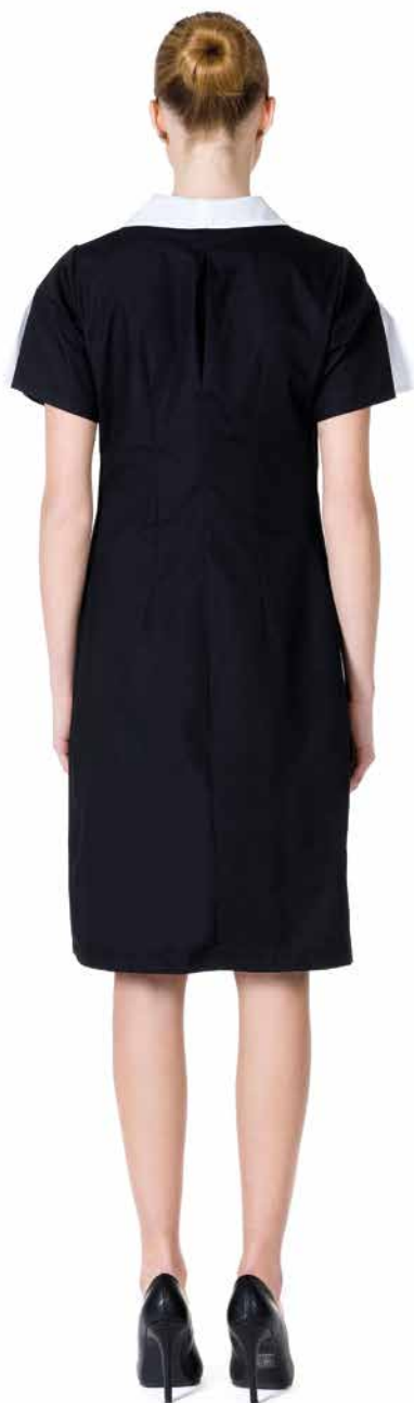
CMD324 Camice Donna 65% Poliestere - 35% Cotone Taglie: XS, S, M, L, XL, XXL Colore: Nero + Bianco