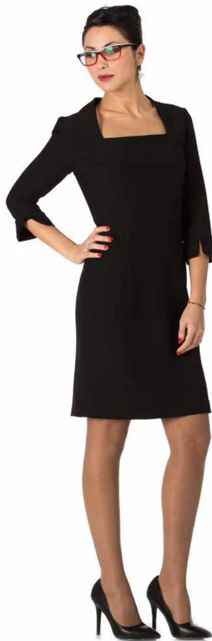
VED650 Abito a Tubino Donna 97% Poliestere - 3% Elastan Taglie: 38-40-42-44-46-48-50-52-54 Colore: Nero