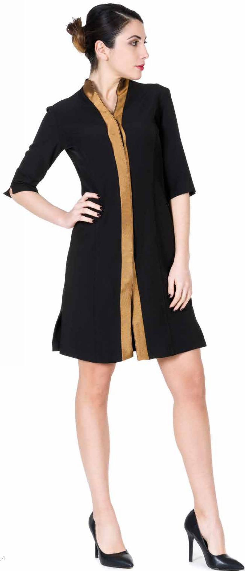
VED378 Abito Donna 97% Poliestere - 3% Elastan Taglie: 38-40-42-44-46-48-50-52-54 Colore: Nero + 115 (Bronzo)