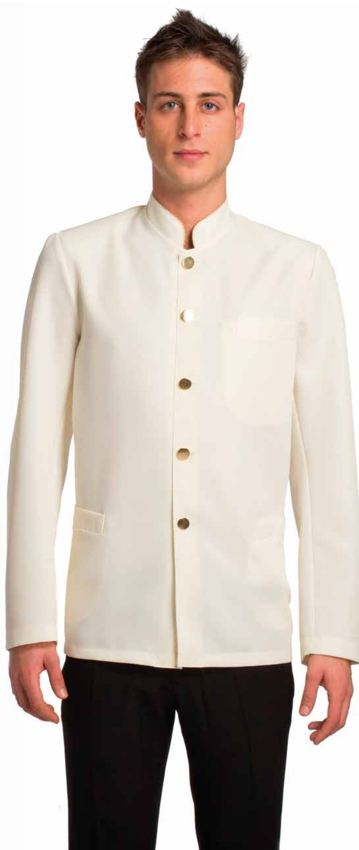
GIU074 Giacca Uomo Coreana 100% Poliestere Taglie: S, M, L, XL, XXL Colore: 100 (Panna) + Fil. Oro