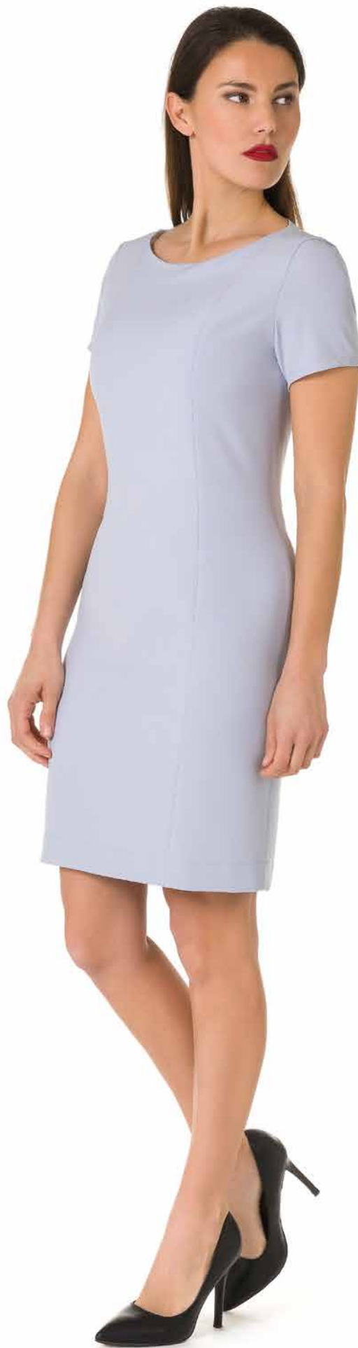
VED667 Abito Donna 65% Poliestere - 30% Viscosa - 5% Elasten Taglie: 38-40-42-44-46-48-50 Colore: 91-19 (Azzurro)