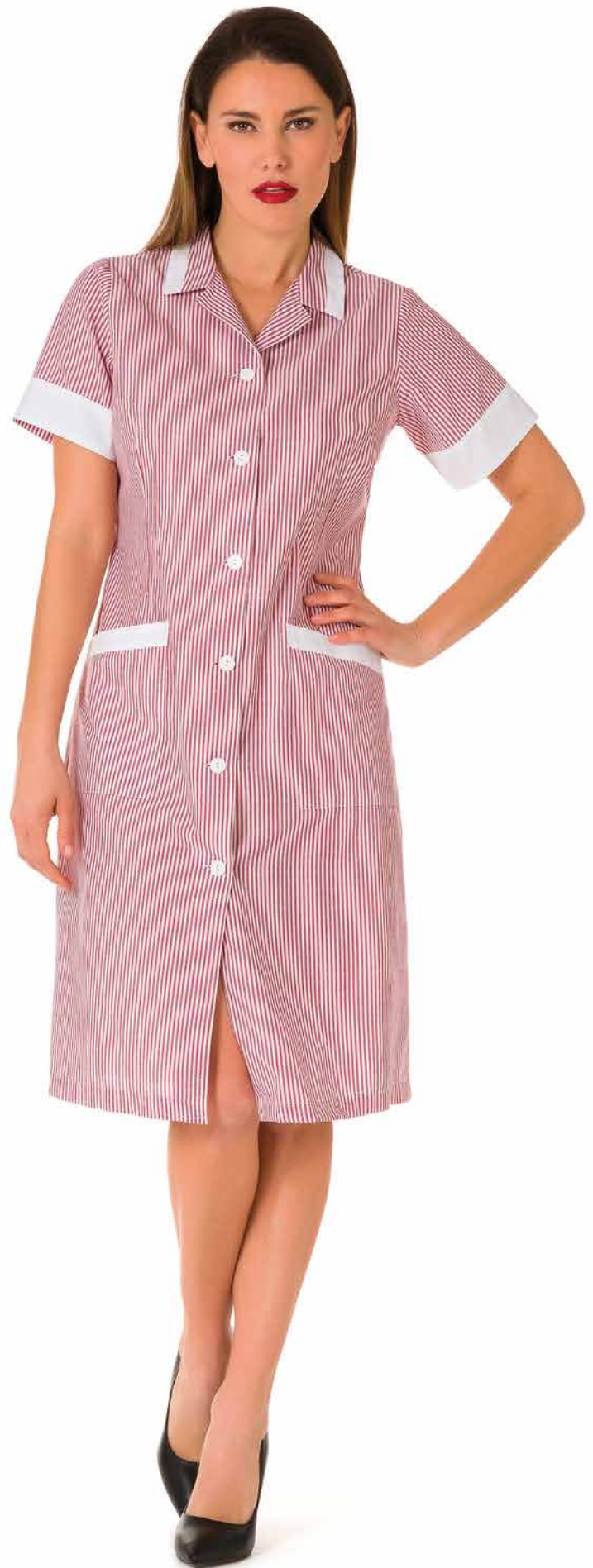
CMD334 Camice Donna 65% Poliestere - 35% Cotone Taglie: XS, S, M, L, XL, XXL Colore: 84-18 (Riga Rossa) + Bianco