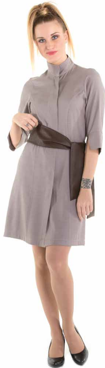
VED363 Abito Donna 50% Poliestere - 50% Bambù Taglie: XS, S, M, L, XL, XXL Colore: 71-18 (Bambù Beige) + 61-17 (Ecopelle Marrone)